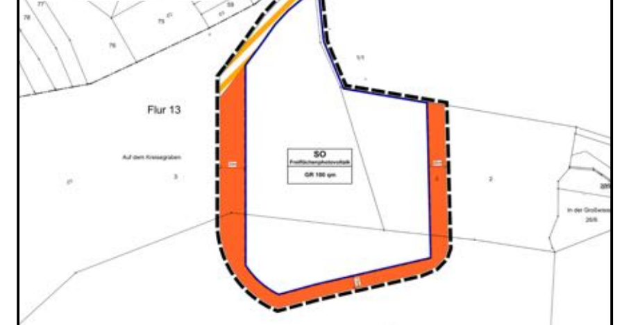
Bebauungsplan vor der Änderung

Grenze des räumlichen Geltungsbereichs der Bebauungsplanänderung (§ 9 Abs. 7 BauGB)